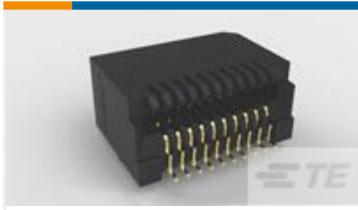
TE 零件编号1367073-1 20 POS SMT CONN, SFP, 15AU