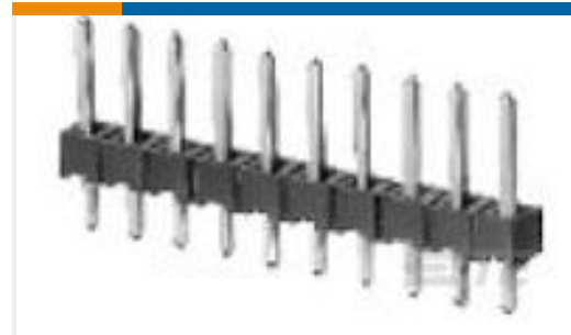
TE 零件编号5-146280-3 03 MODII HDR SRST B/A . 100CL