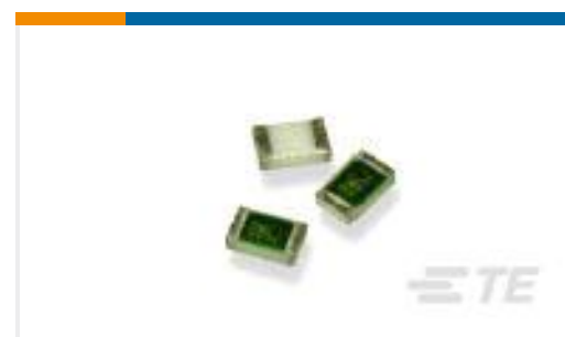
TE 零件编号9-1676481-9 CPF 0603 120K 0.1% 25PPM 1K RL