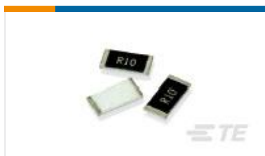
TE 零件编号2-2176057-9 RLP73K 3A R15 1% 1K RL