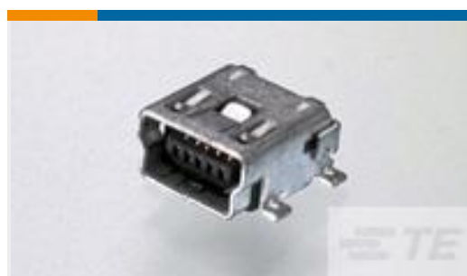
TE 零件编号1734327-2 MINI USB, TYPE A, R/A, SMT