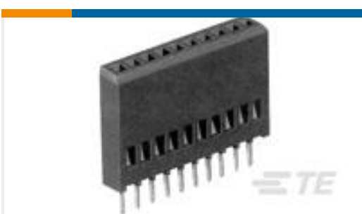
TE 零件编号5-104192-2 10 SYSTEM 50 RCPT ASSY SRST SN