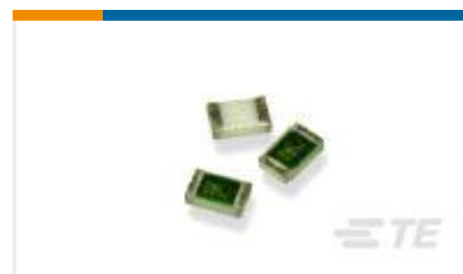
TE 零件编号3-1879213-6 CPF 0402 60R4 0.1% 25PPM 1K RL