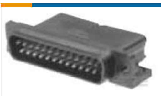
TE 零件编号5747467-1 HD-20 PLUG 9P RA 590