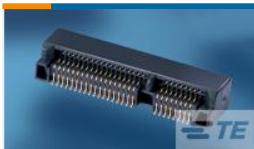
TE 零件编号1775862-2 mSATA/mini PCI-E 5.2H Type I G/F