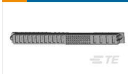
TE 零件编号6450863-5 MBXLE VERT RCPT 7ACP