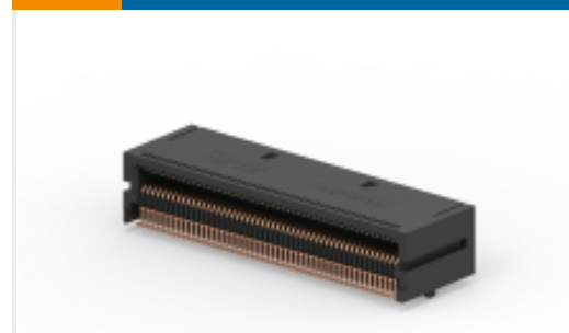
TE 零件编号2274845-1 CFP2 RECEPTACLE ASSEMBLY