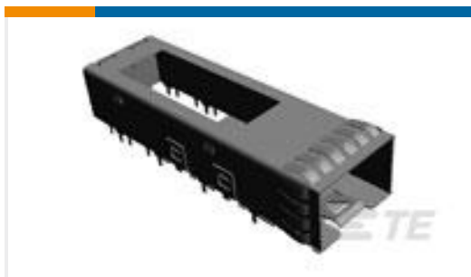
TE 零件编号2110304-1 SFP+ 1x1 Cage Assembly, Solder Tail