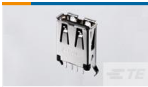
TE 零件编号1734366-3 Std USB Type A, VT, T/H, Blue