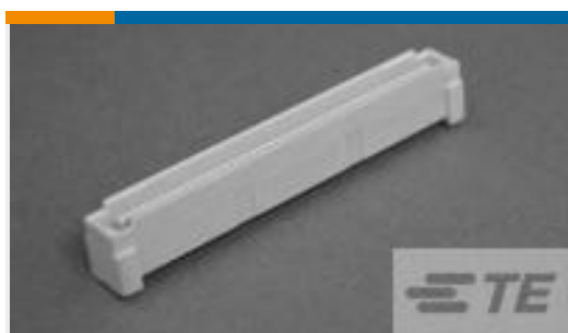
TE 零件编号6123002-5 0.8FH,P08H.5,120,30/Sn,TU