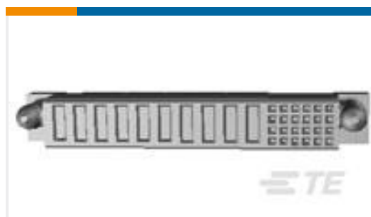
TE 零件编号6450551-6 MBXL VERT RCPT 24S+10HDP