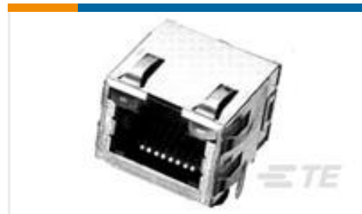
TE 零件编号3-406549-0 IMJ,1X1,PNL GRD,LED(G /OG), SN