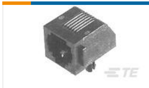
TE 零件编号1775445-2 MODULAR JACK, RJ11, LOW PROFILE, 15u" Au