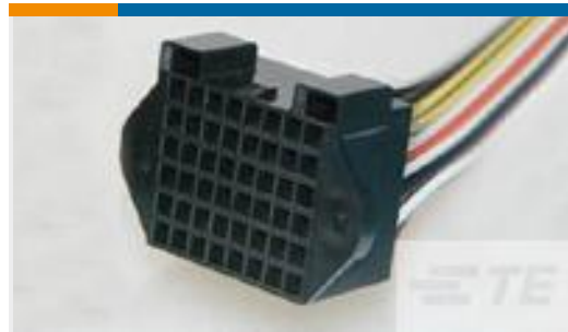
TE 零件编号1934142-1 UPC 48 Pos Plug Housing