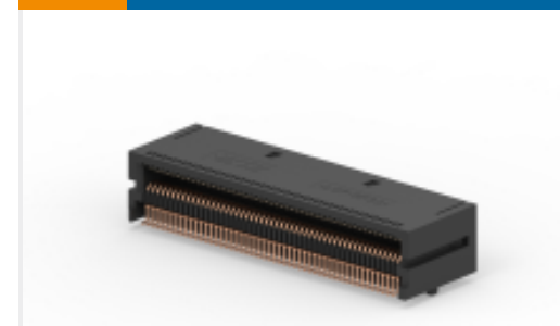
TE 零件编号2274845-1 CFP2 RECEPTACLE ASSEMBLY