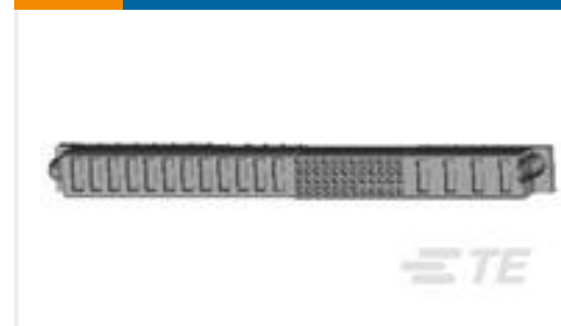
TE 零件编号6450863-5 MBXLE VERT RCPT 7ACP