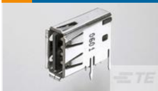
TE 零件编号1-1734775-1 Std USB Type A, Flag, T/H, 1.8A