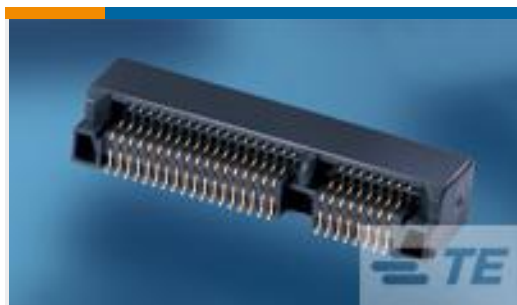
TE 零件编号1775862-2 mSATA/mini PCI-E 5.2H Type I G/F