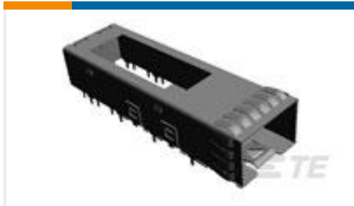
TE 零件编号2110304-1 SFP+ 1x1 Cage Assembly, Solder Tail