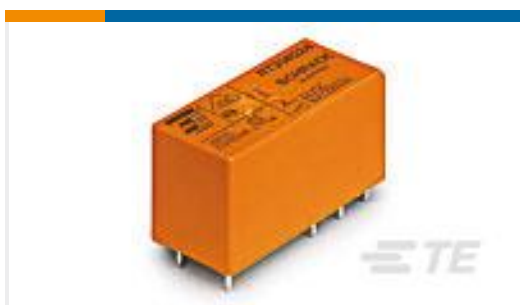
TE 零件编号4-1393239-9 RT184024