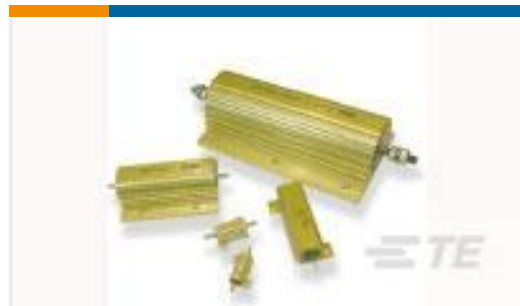
TE 零件编号6-1625999-6 HSC100 390R 5%