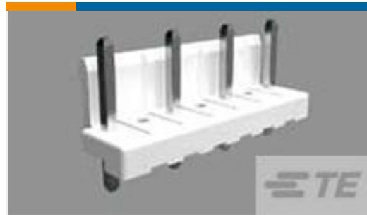
TE 零件编号7-1123724-3 3.96EP HDR ASSY 3(5)P (NATURAL GWT)