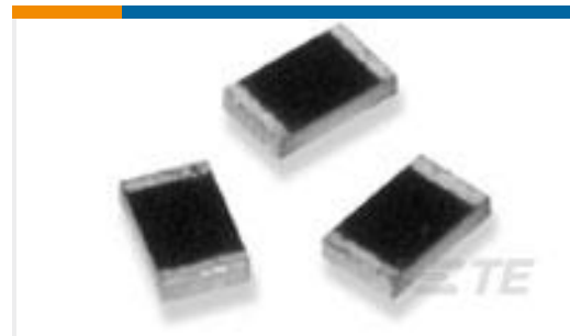
TE 零件编号4-1879261-4 RP 2B 8K25 0.1% 15PPM 1K RL