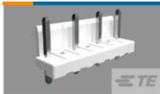
TE 零件编号7-1123724-1 3.96EP HDR ASSY 4(7)P (NATURAL GWT)