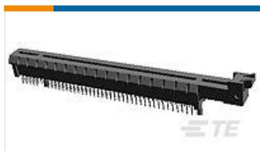
TE 零件编号1-1775793-8 PCI-E 164P w/ L_GRN_Latch 15u" Au