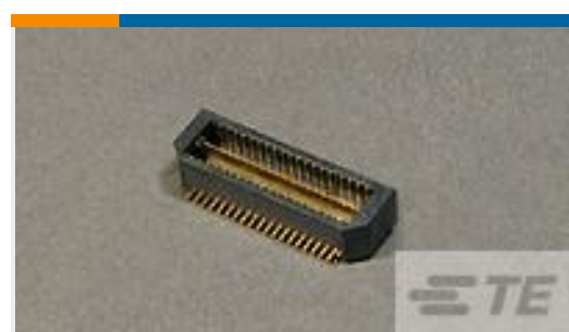
TE 零件编号2-1658044-1 MSB0.80PL5ASY040FL,-,F,- TY