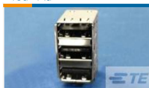
TE 零件编号5-1734309-7 USB TRIPLE ROW A TYPE, DIM B=2.84mm