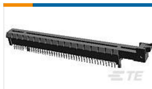
TE 零件编号1775793-5 PCI-E 164P w /R_GRN_Latch BLK_HSG 15u" Au