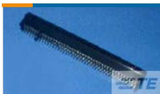
TE 零件编号1734774-6 PCI EXP 3.1L 64 POS WHT 15u"