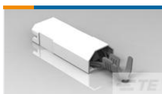
TE 零件编号521317-2 ULTRA-POD 250 ASSY REC 18-14 AWG TPBR