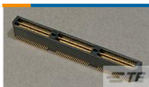
TE 零件编号2-1658045-3 MSB0.80PL8ASY120FL,-,F,- TY