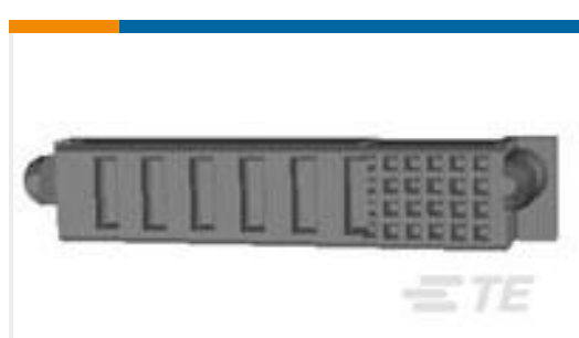
TE 零件编号6450861-3 MBXLE VERT RCPT 24S + 6P