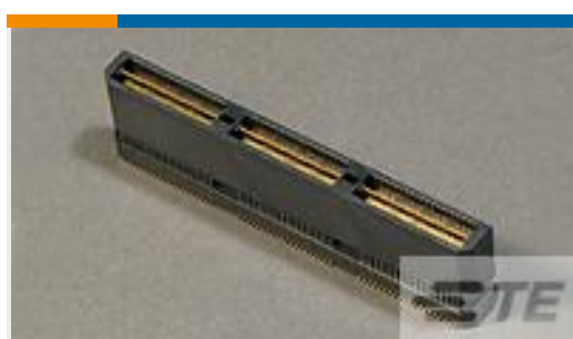
TE 零件编号2-1658047-3 MSB0.80PL16ASY120FL,-,F,- TY