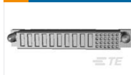
TE 零件编号6450551-6 MBXL VERT RCPT 24S+10HDP