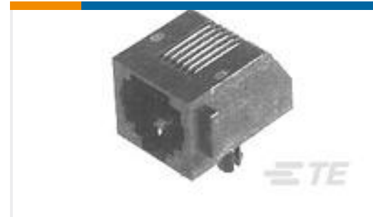
TE 零件编号1775445-2 MODULAR JACK, RJ11, LOW PROFILE, 15u" Au