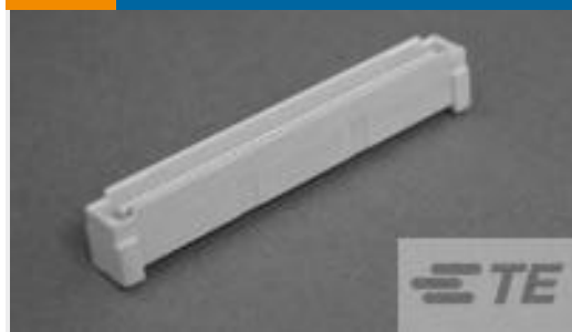
TE 零件编号6123002-5 0.8FH,P08H.5,120,30/Sn,TU