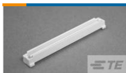
TE 零件编号1-5084614-0 0.8FH,P05H.5,200,30/Sn,TU