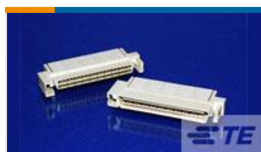
TE 零件编号6367580-3 ASSY Z-DOK+4 HOST BOARD 24PR