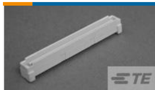
TE 零件编号7-5177986-3 0.8FH,P07H.5,080,30/Sn,TR, SC