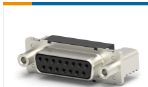
TE 零件编号1-1740196-5 15P HD20 REC.HDR EUROSTYLE SMT