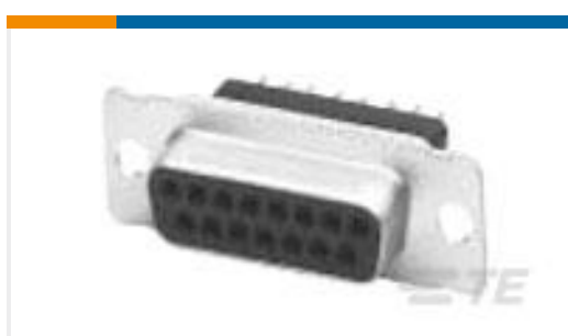
TE 零件编号205738-3 25 RCPT SP/MS STD