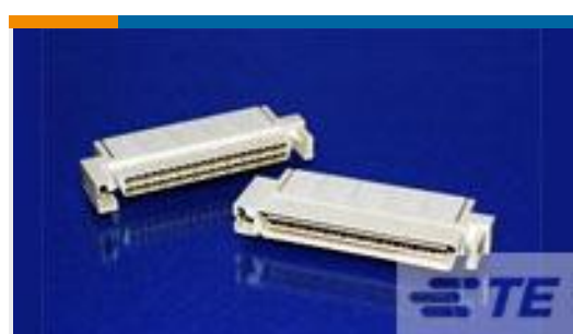
TE 零件编号6367583-1 ASSY Z-DOK+4 ADAPTER BRD 24PR