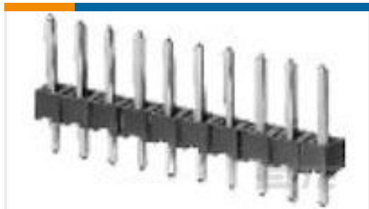
TE 零件编号5-146280-2 02 MODII HDR SRST B/A . 100CL