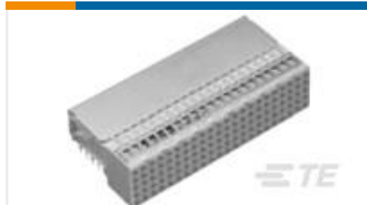
TE 零件编号5352171-1 Z-PACK/B19 RAF 95P