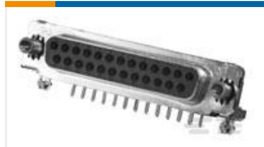
TE 零件编号5747844-5 09 MSFL RCPT RA 318 (SL, FM,BL)