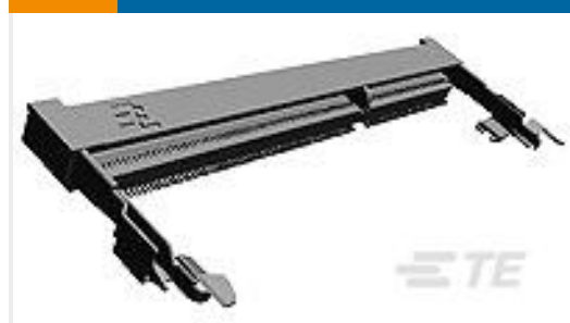
TE 零件编号2-2013310-1 EMBOSS TAPE DDR3 204P 9.2H STD