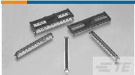
TE 零件编号3-5353652-6 .5FHP08H,440,B,GIG,08/Sn, HT,NSYes