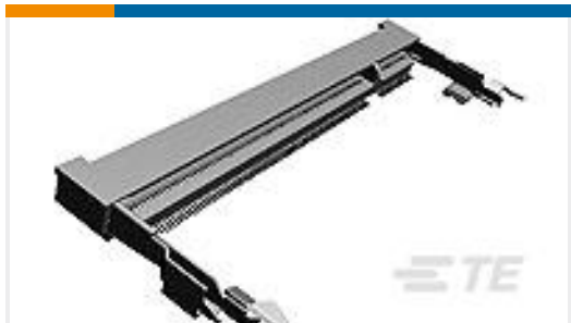
TE 零件编号1717254-1 EMBOSS ASS'Y DDR SODIMM SOCKET