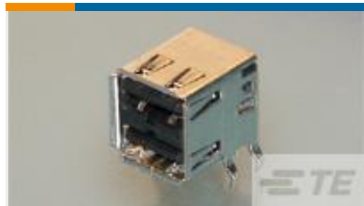
TE 零件编号5787745-2 USB A R/A STAK ASSY THRU HOLE