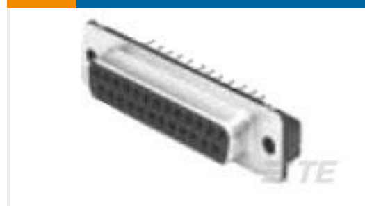
TE 零件编号2-747706-0 09 RCPT SP/FMS BRDLK