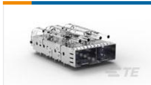
TE 零件编号2007262-1 SFP+ 1x2 Cage Assembly, Light