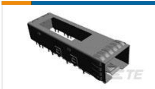
TE 零件编号2110304-1 SFP+ 1x1 Cage Assembly, Solder Tail