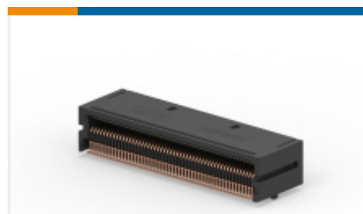
TE 零件编号2274845-1 CFP2 RECEPTACLE ASSEMBLY