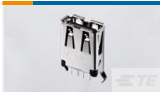
TE 零件编号1734366-3 Std USB Type A, VT, T/H, Blue