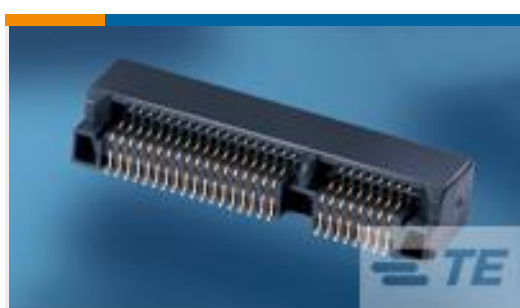
TE 零件编号1775862-2 mSATA/mini PCI-E 5.2H Type I G/F