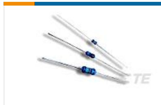
TE 零件编号1-1879027-7 YR1 0.1% 715K