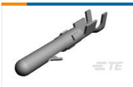
TE 零件编号61116-6 CMNL PIN 24-18 AUNIPBZ