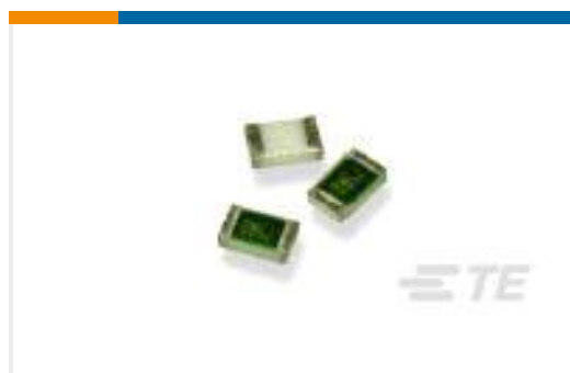
TE 零件编号2-1614891-0 CPF 0805 105R 0.1% 25PPM 1K RL