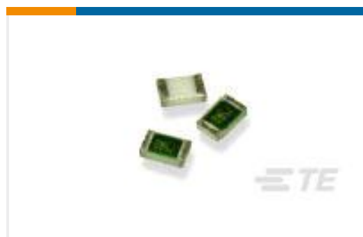
TE 零件编号4-1614891-0 CPF 0805 182R 0.1% 25PPM 1K RL