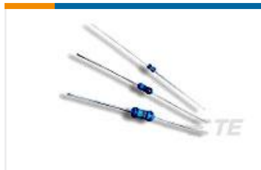
TE 零件编号1622795-1 YR1 0.1% 24K3