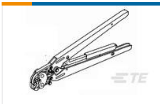
TE 零件编号90009-8 DAHT PIDG FASTON