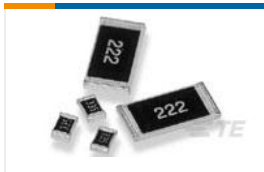
TE 零件编号9-1879507-8 CRGH0603 1% 100R 0.2W