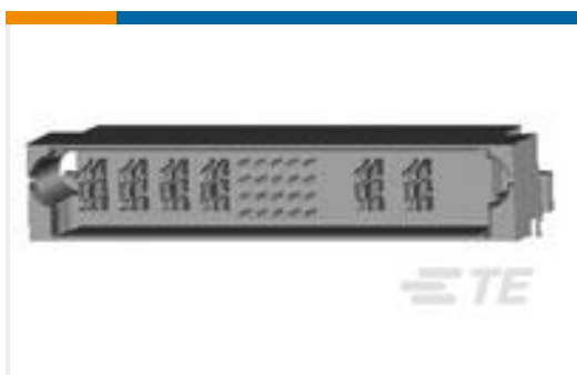
TE 零件编号1-6450830-5 MBXL R/A HDR 4P + 28S + 3ACP