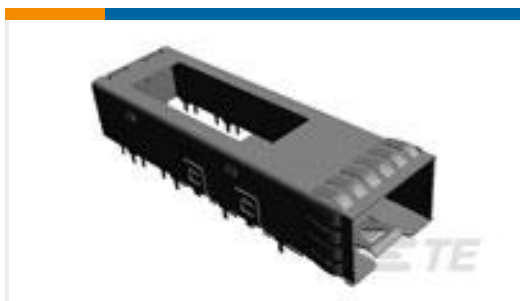
TE 零件编号2110304-1 SFP+ 1x1 Cage Assembly, Solder Tail