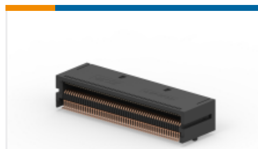
TE 零件编号2274845-1 CFP2 RECEPTACLE ASSEMBLY