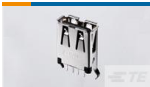
TE 零件编号1734366-3 Std USB Type A, VT, T/H, Blue