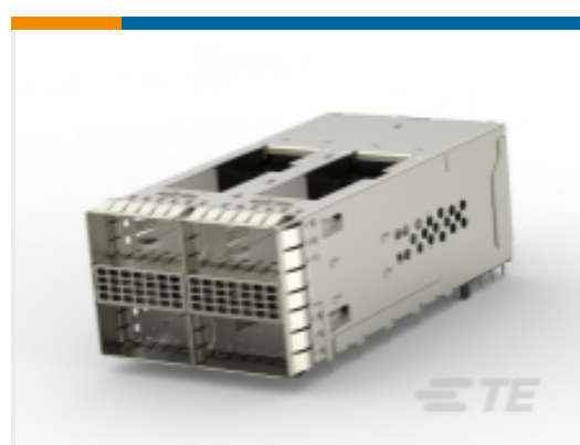
TE 零件编号2299870-4 THERMAL ZQSFP+ STACKED REC ASSEMBLY 2X2