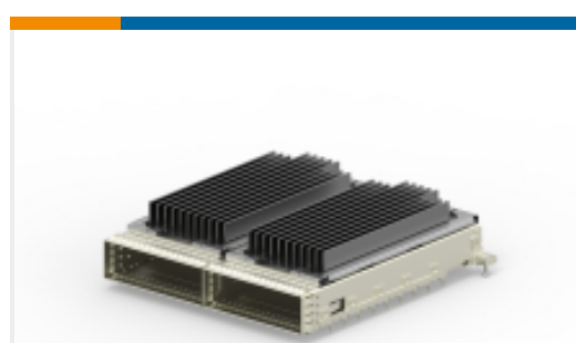
TE 零件编号2287075-2 CFP2 HARDWARE KIT, 1X2