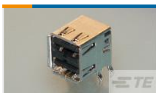
TE 零件编号292323-6 REC ASSY RIGHT ANGLE STACKED THRUHOLE US