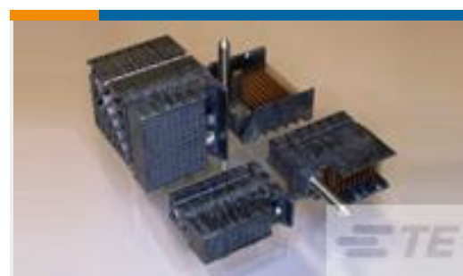
TE 零件编号2057760-1 IMP100S,H,V3P8C,UG, OEW46,4.5