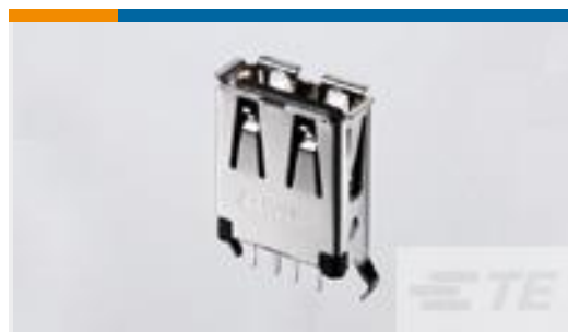
TE 零件编号1734366-3 Std USB Type A, VT, T/H, Blue