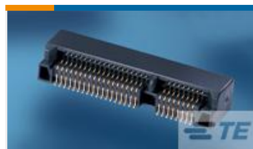
TE 零件编号1775862-2 mSATA/mini PCI-E 5.2H Type I G/F