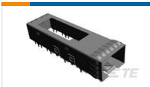
TE 零件编号2110304-1 SFP+ 1x1 Cage Assembly, Solder Tail