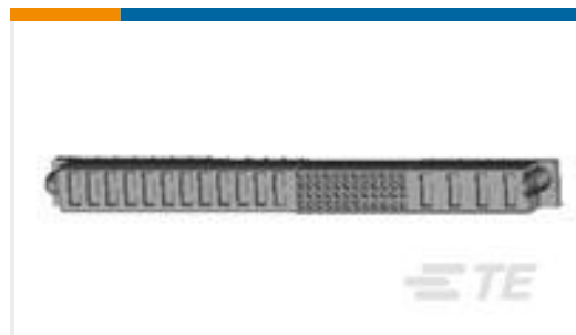
TE 零件编号6450863-5 MBXLE VERT RCPT 7ACP