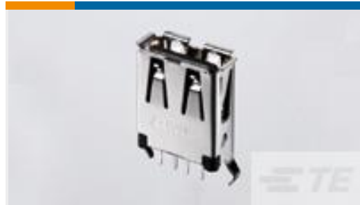
TE 零件编号1734366-3 Std USB Type A, VT, T/H, Blue