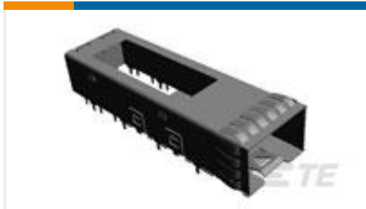
TE 零件编号2110304-1 SFP+ 1x1 Cage Assembly, Solder Tail