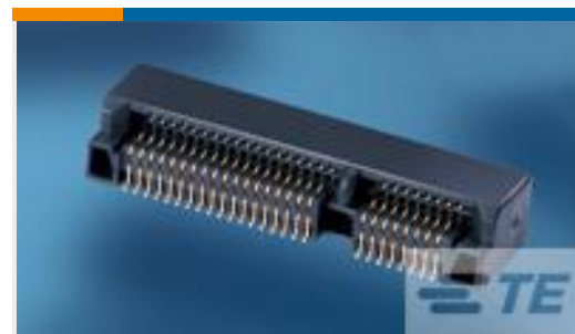
TE 零件编号1775862-2 mSATA/mini PCI-E 5.2H Type I G/F