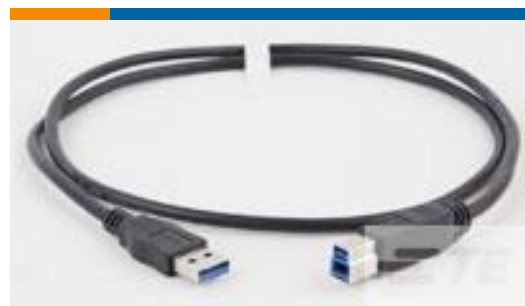
TE 零件编号 1-2117154-5 C/A, USB3.0 A TYPE TO B TYPE,