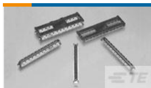
TE 零件编号3-1827253-6 .5FHP05H,220,S,GIG,08/Sn, HT,NSYes