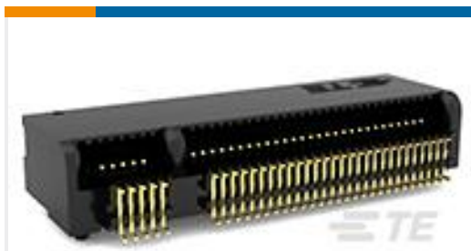
TE 零件编号1-2199230-6 M.2 0.5PITCH 4.2H KEY M 30U AU