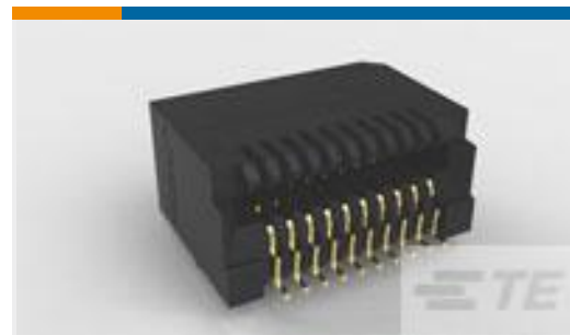
TE 零件编号1888247-1 20 POS SMT CONN, SFP /SFP+, 30A