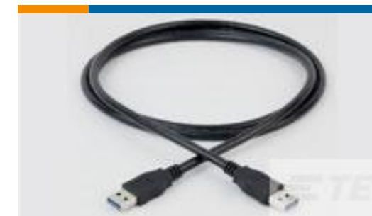
TE 零件编号 2-2117156-0 C/A, USB3.0 A TYPE TO A TYPE,