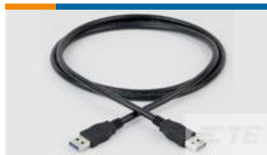
TE 零件编号 1-2117156-0 C/A, USB3.0 A TYPE TO A TYPE,