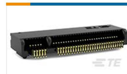
TE 零件编号1-2199119-5 M.2 0.5PITCH 3.2H KEY M 15U" AU