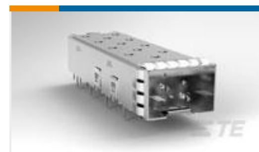
TE 零件编号2007194-1 SFP+ 1x1 Cage Assembly, PCI, Solder Tail