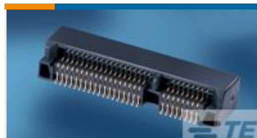
TE 零件编号2041119-1 mSATA/mini PCI-E 4H Type I G/F