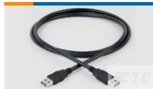
TE 零件编号 1-2117156-5 C/A, USB3.0 A TYPE TO A TYPE,