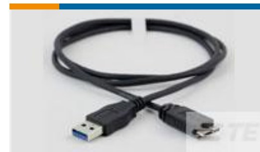
TE 零件编号 1-2117155-0 C/A, USB3.0 A TYPE TO MICRO B,