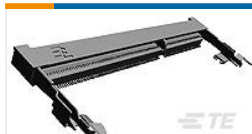
TE 零件编号2-2013289-1 EMBOSS TAPE DDR3 204P 5.2H STD