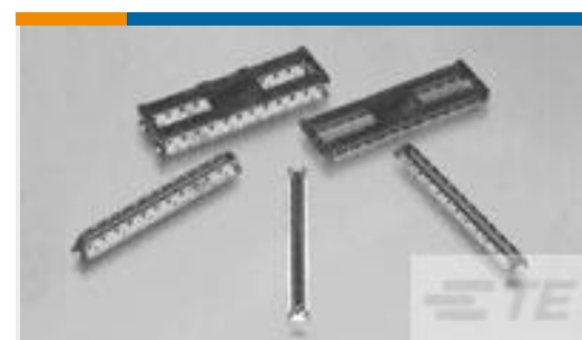
TE 零件编号3-1827233-6 .5FHP05H,440,B,GIG,08/Sn, HT,NS