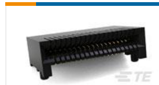
TE 零件编号1761987-9 ReceptacleConnAssm38PosTape /Re