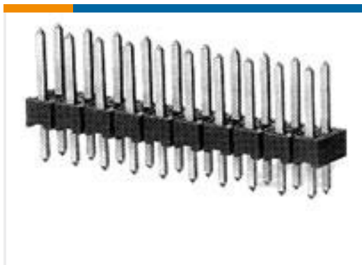
TE 零件编号1-102973-5 30 MODII HDR DRST B/A . 100CL