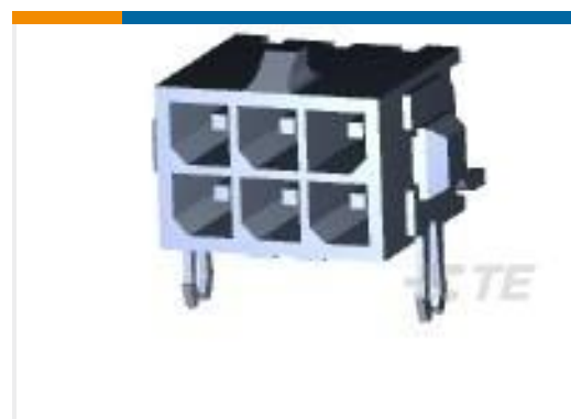
TE 零件编号3-794626-6 06P MICRO MNL ASSY,R /A,SMT,LF