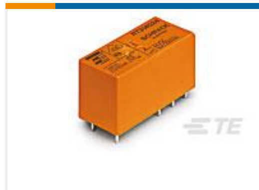
TE 零件编号5-1393238-7 RTD14F03