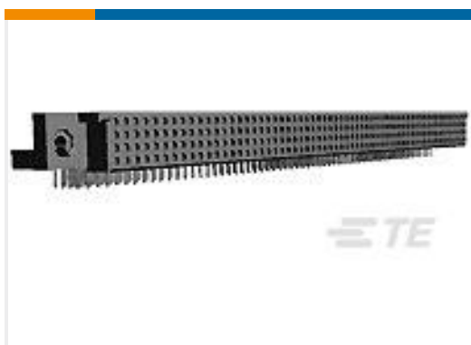
TE 零件编号5532903-2 ASSY,RECPT,R.ANGLE, HDI,LEAD-FR