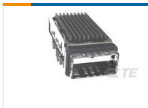
TE 零件编号2149157-3 CXP RCPT KIT W/HEAT SINK