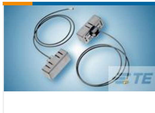
TE 零件编号1513472-8 UAM Assembly 250mm cable