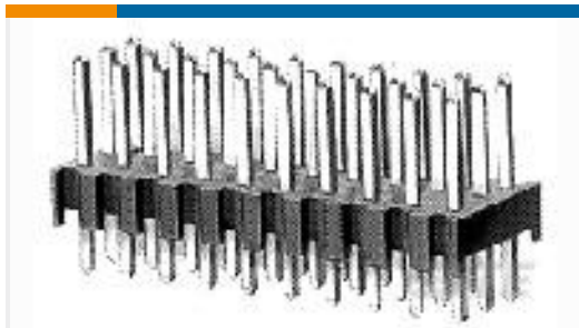
TE 零件编号5-103817-2 12 MODII HDR 3RST UNSHRD .100