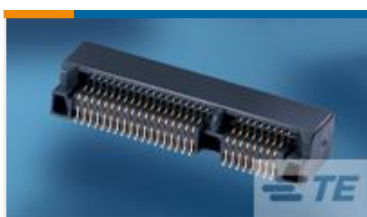
TE 零件编号2041119-2 mSATA/mini PCI-E 4H Type I 10u"