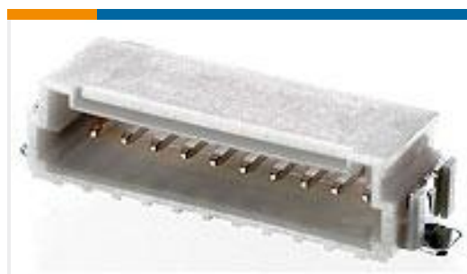
TE 零件编号292228-2 1.5 MINI CT SGL H SMT W /O BOSS