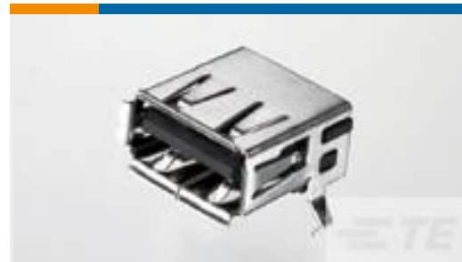
TE 零件编号292303-6 Std USB Type A, R/A, T/H