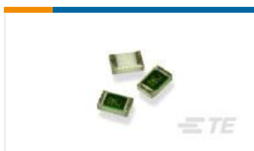
TE 零件编号1-1614959-1 CPF0805 1M5 0.1% 25PPM 1K RL