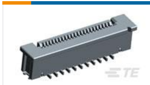
TE 零件编号1734742-6 .5 FPC VT ZIF Type-A 6 CONT