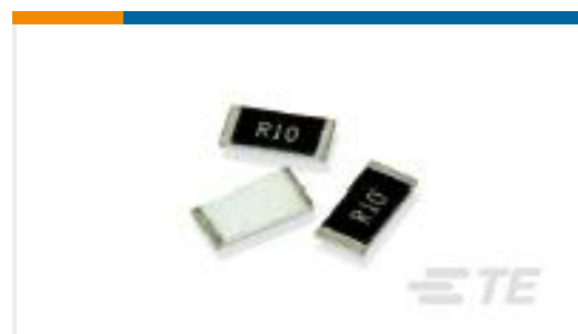
TE 零件编号1-2176056-2 RLP73M 2B R030 5% 5K RL