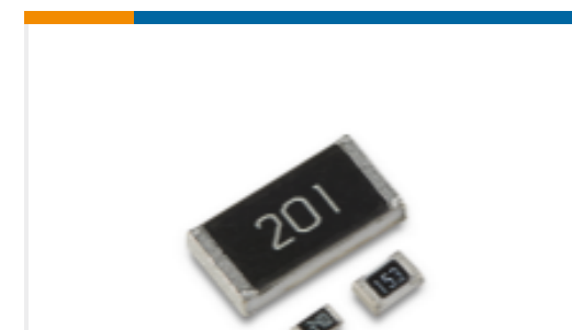
TE 零件编号4-2176326-0 CRGP 0603 18K 1%