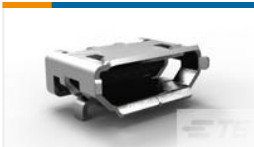
TE 零件编号2013499-1 MICRO USB, TYPE B