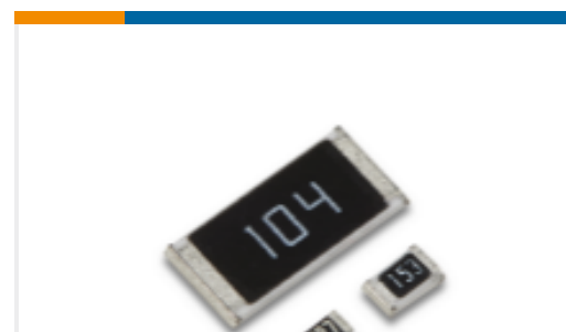
TE 零件编号1-2176340-9 CRGCQ 0603 1K0 5%