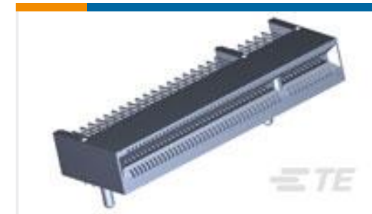
TE 零件编号1-1761465-1 PCI Express RA assy 5.8 mm slot 3.1mm pc