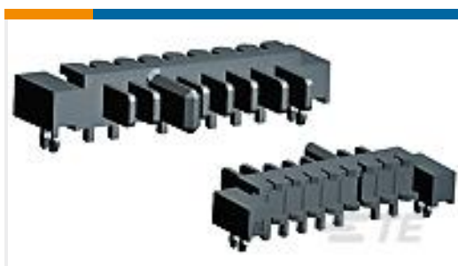
TE 零件编号1-1827654-1 2mm pitch Battery Plug Assy. 7Pos. H=4.0