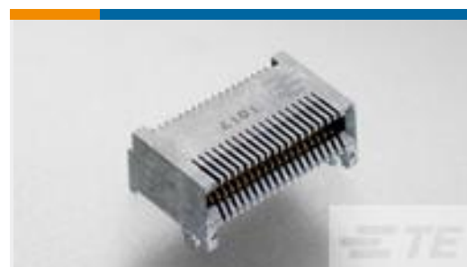
TE 零件编号2110819-1 QSFP+ Enh EVERCLEAR PT Conn