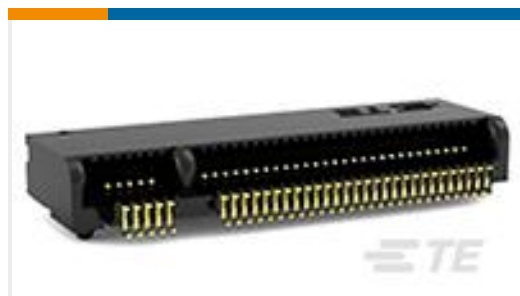
TE 零件编号1-2199119-5 M.2 0.5PITCH 3.2H KEY M 15U" AU