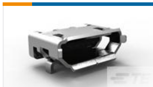
TE 零件编号2013499-1 MICRO USB, TYPE B