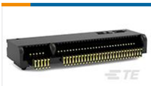
TE 零件编号2199119-3 M.2 0.5PITCH 3.2H KEY B 15U" AU