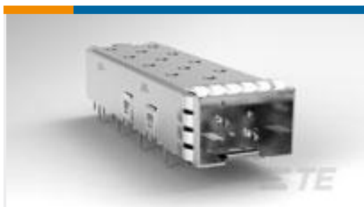
TE 零件编号2007194-1 SFP+ 1x1 Cage Assembly, PCI, Solder Tail