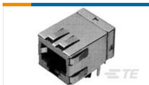
TE 零件编号5406299-1 MJ ASSY,S/P,8POS,SH, RVPGT,CAT 5e