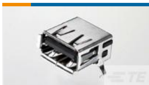
TE 零件编号292303-7 Std USB Type A, R/A, SMT, Offset, Natural