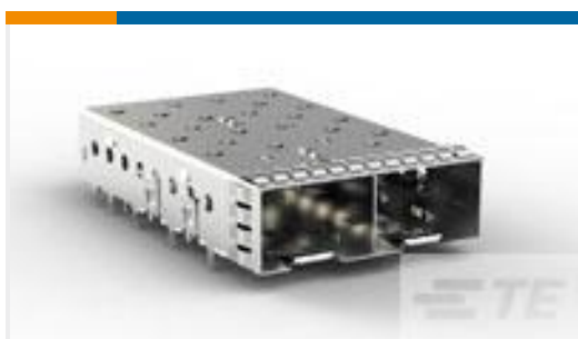
TE 零件编号2007263-1 SFP+ 1x2 Cage Assembly