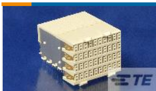
TE 零件编号1469001-1 HM-ZD 4PR RECP 80P