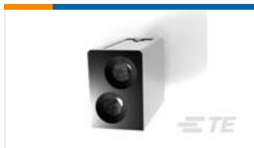
TE 零件编号1-1469373-1 ATCA GUIDE MODULE RA FEMALE