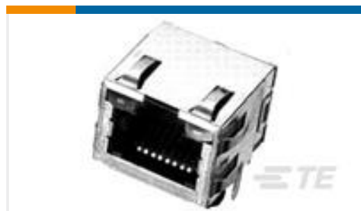
TE 零件编号2-406549-8 IMJ,1X1,PNL GRD,LED(YG /YG), SN