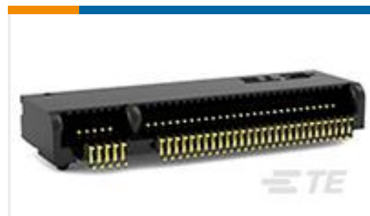
TE 零件编号1-2199119-5 M.2 0.5PITCH 3.2H KEY M 15U" AU