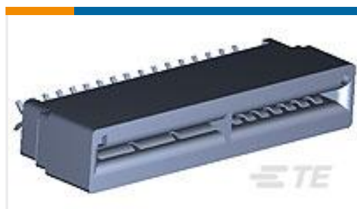
TE 零件编号2007088-1 CONNECTOR ASSEMBLY, SEC II POWER, 6P+16S