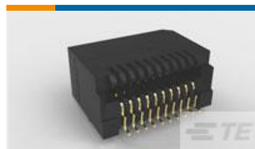
TE 零件编号1888247-1 20 POS SMT CONN, SFP /SFP+, 30A