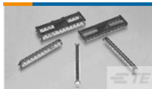
TE 零件编号3-5353652-6 .5FHP08H,440,B,GIG,08/Sn, HT,NSYes