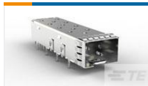
TE 零件编号2007198-1 SFP+ 1x1 Cage Assembly, Press-