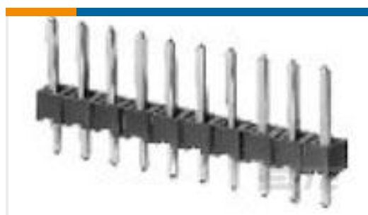
TE 零件编号5-146281-2 02 MODII HDR SRST B/A LF