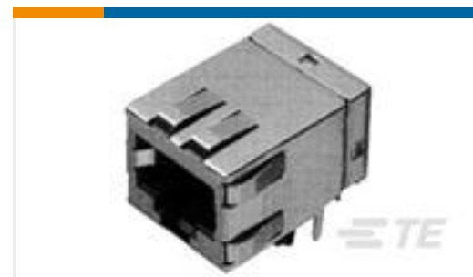
TE 零件编号5406299-1 MJ ASSY,S/P,8POS,SH, RVPGT,CAT 5e