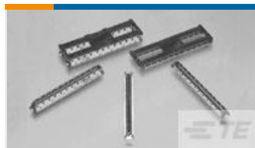
TE 零件编号3-1827233-6 .5FHP05H,440,B,GIG,08/Sn, HT,NS