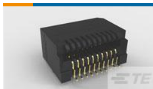
TE 零件编号1888247-2 20 POS SMT CONN, SFP /SFP+, 15A