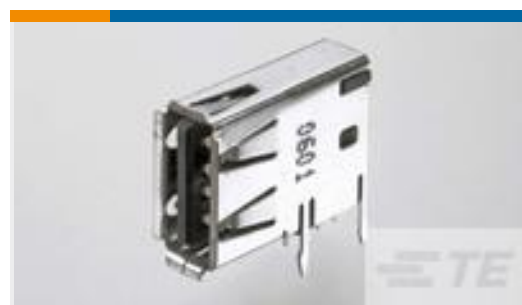
TE 零件编号292336-1 Std USB Type A, Flag, T/H