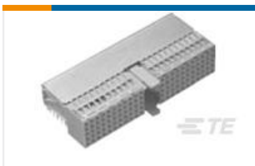
TE 零件编号5352068-9 Z-PACK/A RAF 110P