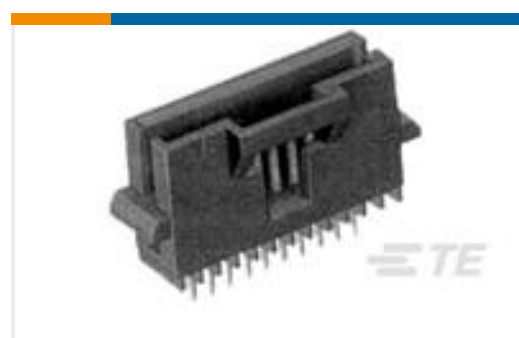
TE 零件编号5-104071-7 04 SYSTEM 50 HDR SRST SHRD SN