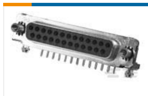
TE 零件编号5745782-2 15 MSFL RCPT RA 318 (FM)