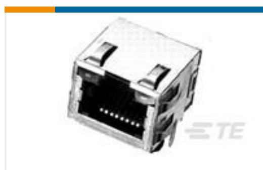
TE 零件编号6116173-4 INV MJ,1X1,PNL GRD, SHLD,LED (Y/G)