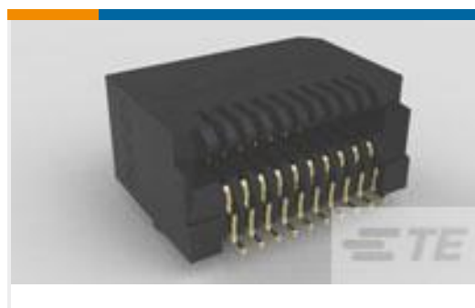
TE 零件编号1658197-1 SFP, 20 POSN, 0.8MM PITCH, SUR