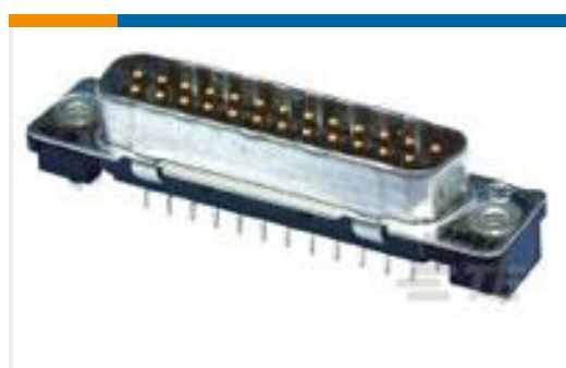
TE 零件编号2-5747705-1 37 PLUG SP/FMS SCRLK