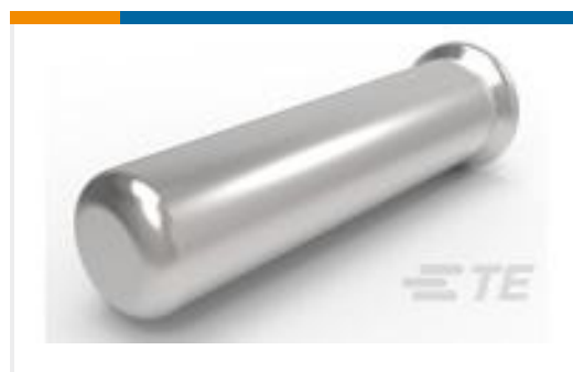
TE 零件编号5050462-8 SOCKET,MIN-SPR SN-AU SER-2