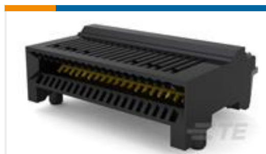
TE 零件编号1551920-2 zQSFP+ connector assembly