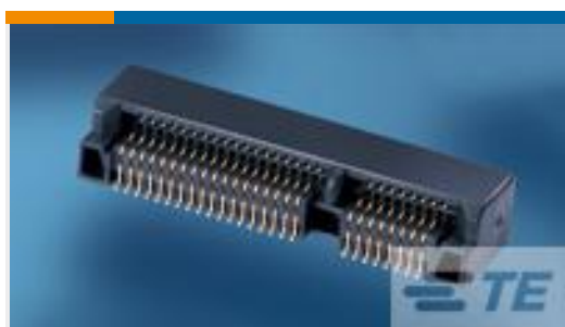
TE 零件编号2041119-1 mSATA/mini PCI-E 4H Type I G/F