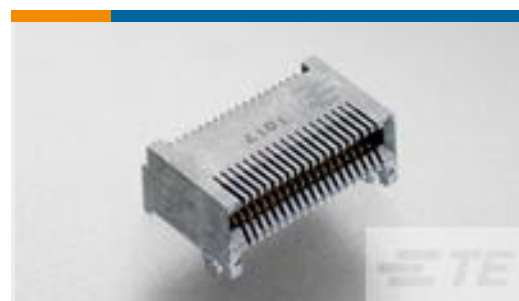
TE 零件编号2110819-1 QSFP+ Enh EVERCLEAR PT Conn