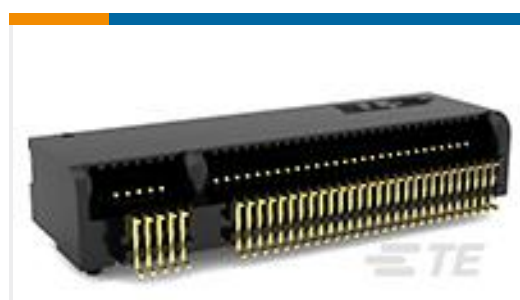
TE 零件编号1-2199230-6 M.2 0.5PITCH 4.2H KEY M 30U AU