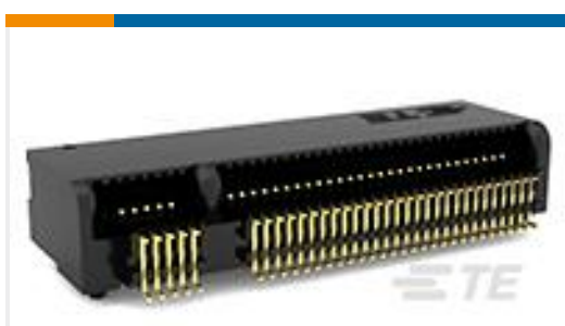
TE 零件编号2199230-3 M.2 0.5PITCH 4.2H KEY B 15U" AU