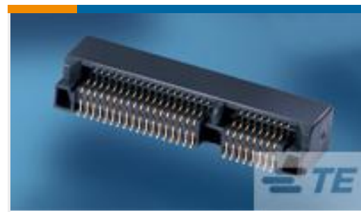
TE 零件编号1775862-2 mSATA/mini PCI-E 5.2H Type I G/F