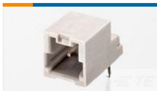
TE 零件编号292206-6 MINI CT SGL DIP H 6P NAT