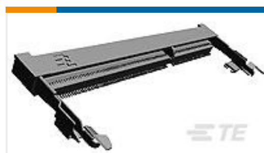
TE 零件编号2-2013290-1 EMBOSS TAPE DDR3 204P 5.2H RVS