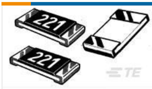
TE 零件编号2-2176071-2 3521 1M0 1% 2W