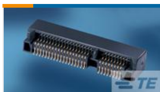
TE 零件编号2041119-1 mSATA/mini PCI-E 4H Type I G/F