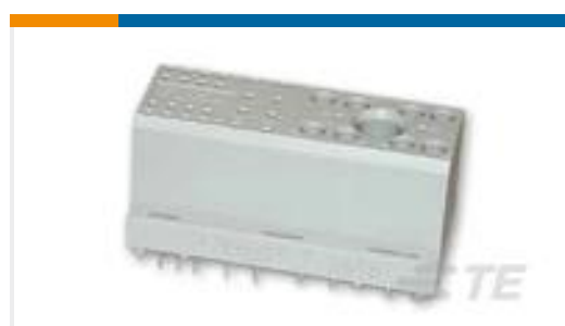
TE 零件编号1766501-1 ATCA ASSY, Vertical Backplane,