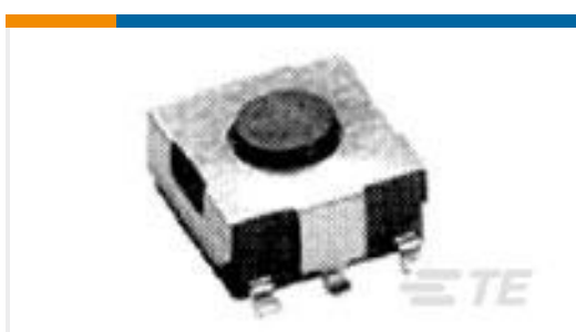
TE 零件编号1-1437565-8 FSM1LPATR=TACT SWITCH 6X6MIL S