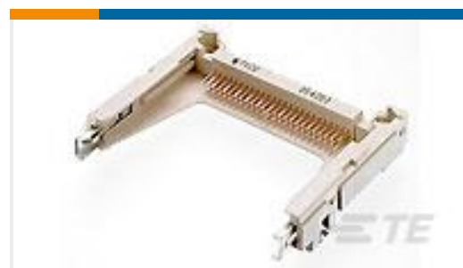
TE 零件编号1734450-1 CF HDR TypeII,50pos,SMT, 2.2mm, W/O mylar