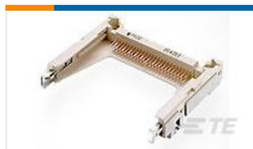
TE 零件编号1734450-1 CF HDR Typell,50pos,SMT, 2.2mm, W/O mylar