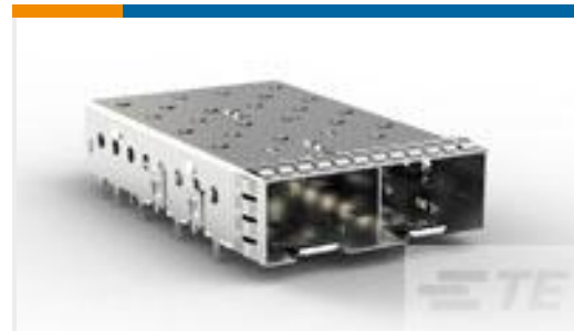
TE 零件编号2007263-1 SFP+ 1x2 Cage Assembly