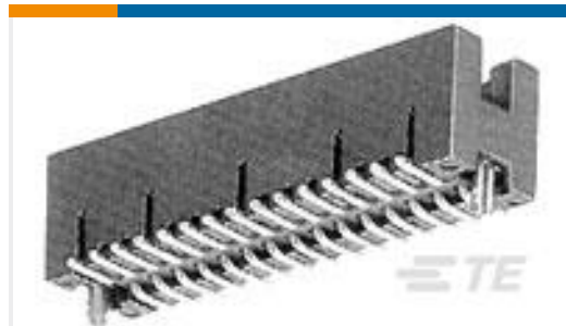
TE 零件编号5-104655-3 20 50/50 HDR DRST SFMNT TIN