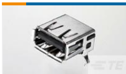
TE 零件编号292303-7 Std USB Type A, R/A, SMT, Offset,Natural