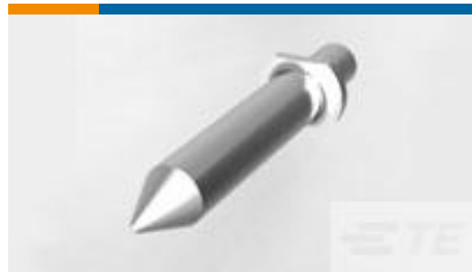
TE 零件编号223956-1 UNV PWR MDL, GUIDE PIN LOCT PL