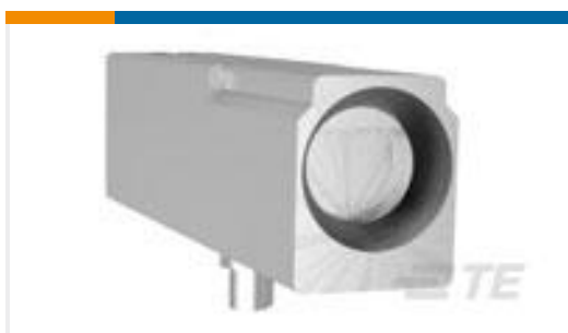
TE 零件编号5223986-1 UPM KEYED GUIDE MODULE