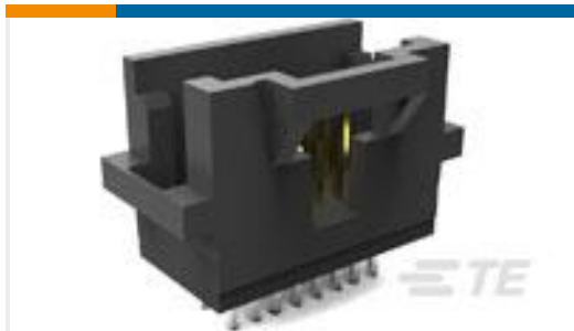
TE 零件编号5-104068-4 40 SYSTEM 50 HDR DRST SHRD